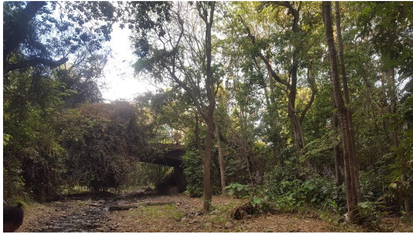
Het park 'Themi Living garden'